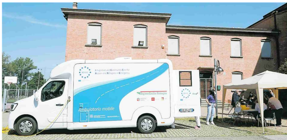
▲ A Borgo Panigale Il camper dei vaccini per gli ultra settantenni parcheggiato in zona Birra

di Rosario Di Raimondo e Valerio Varesi • alle pagine 2 e 3